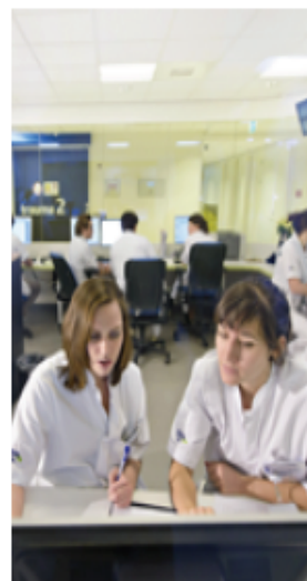
Overal waar personeel met gevoelige informatie werkt, lopen bedrijven risico's.

Volgens de ondernemer ontstaan de meeste problemen door